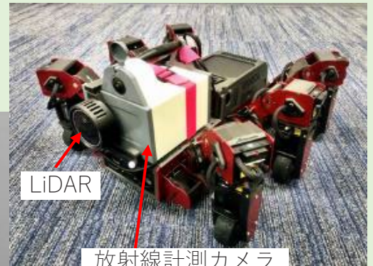
↑ 6脚ロボット ← 階段昇降の様子